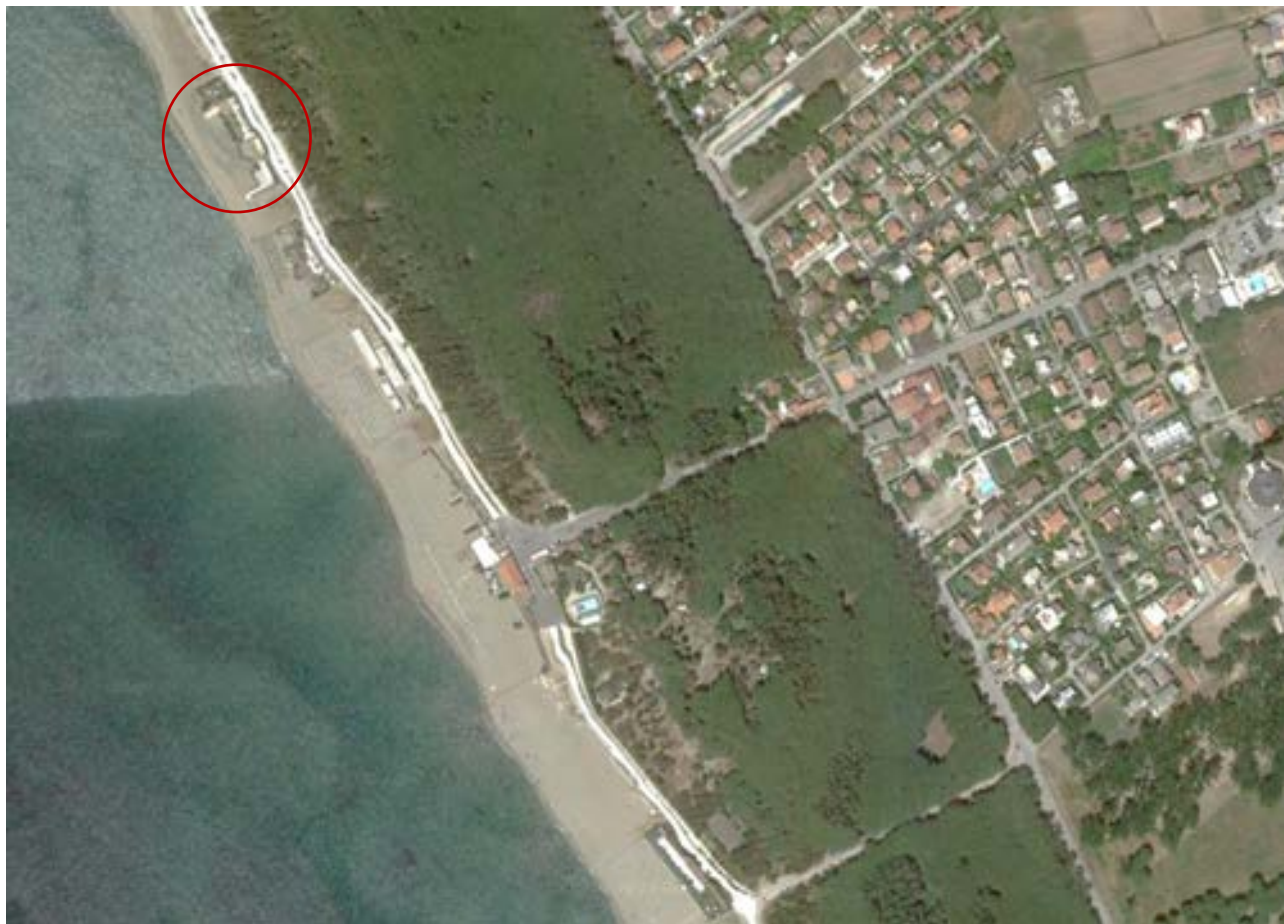
Ubicazione ex Lido Kennedy

L'area demaniale dell'ex Lido Kennedy è ubicata in Via dei Lidi, in località Laura del Comune di Capaccio Paestum, ed è distinta all'Agenzia del Territorio della Provincia di Salerno al foglio di mappa n. 10 nella maggiore consistenza della particella n. 1633. L'area in oggetto confina ad est con il nuovo lungomare, a nord con l'area del lido "Chelys Beach" e a sud con l'area del lido "Dum Dum Republic". L'accesso all'area avviene attraverso il nuovo percorso pavimentato del lungomare.