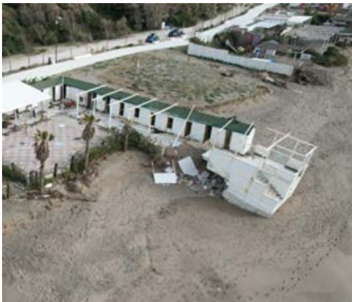
Danni all'ala sud causati dalle ultime mareggiate