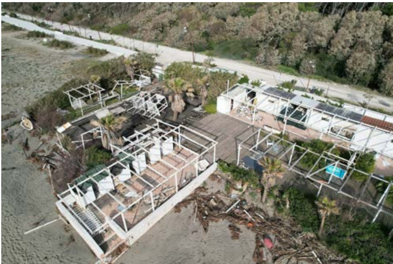
Strutture degradate e fatiscenti - Ala nord